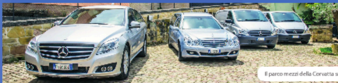
Il parco mezzi della Corvatta srl

Va sottolineato che quella di ospitare la salma di un congiunto presso la struttura "Terracoeli" in attesa delle esequie, è una possibilità ulteriore che viene offerta alle famiglie le quali, in alternativa, possono sempre e comunque decidere di far salutare la salma presso l'abitazione privata, una struttura sanitaria o dove è avvenuto il decesso.